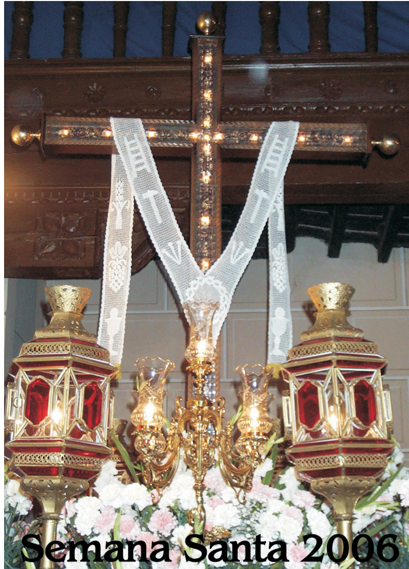
Semana Santa 2006